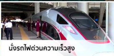
นั่งรถไฟด้วยความเร็วสูง