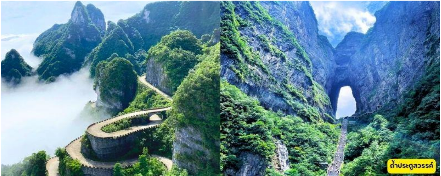
ถ้ำประตูสวรรค์