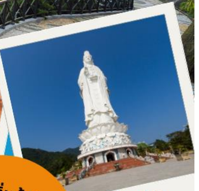
เจ้าแม่กวนอิมวัดหลินอึ้ง