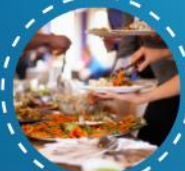
บุฟเฟต์นานาชาติ 2 มื้อ