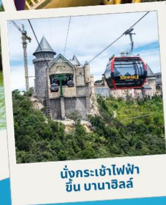
นั่งกระเช้าไฟฟ้าขึ้น บานาฮิลล์