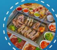
บุฟเฟต์ ชาบู ปิ้งย่าง