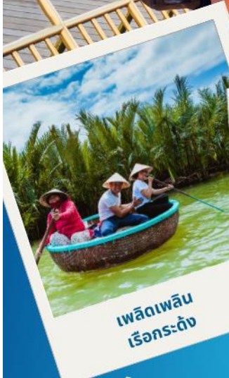
เปลือยเรือกระดิ่ง