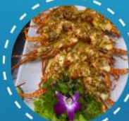
เมนูกุ้งมังกร