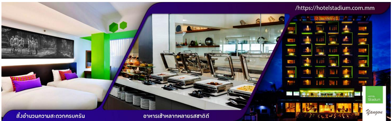
สิ่งแวดล้อมความสะอาดครบครัน

คำ 📍 รับประทานอาหารค่ำ ณ ภัตตาคาร เมนูพิเศษ!!เปิดบักกิง+สลัดกุ้งมังกร 📍 นำท่านเข้าพักที่ HOTEL STADIUM YANGON ระดับ 3 ดาว