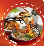
ซาบู ปุฟเฟ็ต