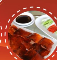
เปิดปีกกึ่ง