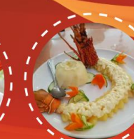
สลัดคุ้งมังกร