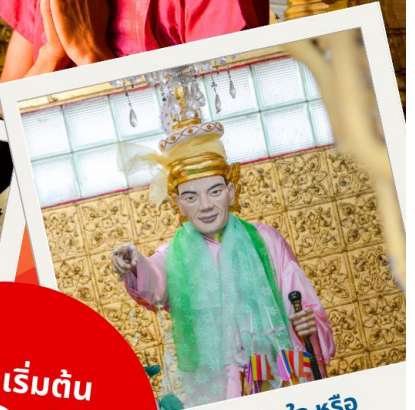
เทพทันใจ หรือ นัตโบโฮย