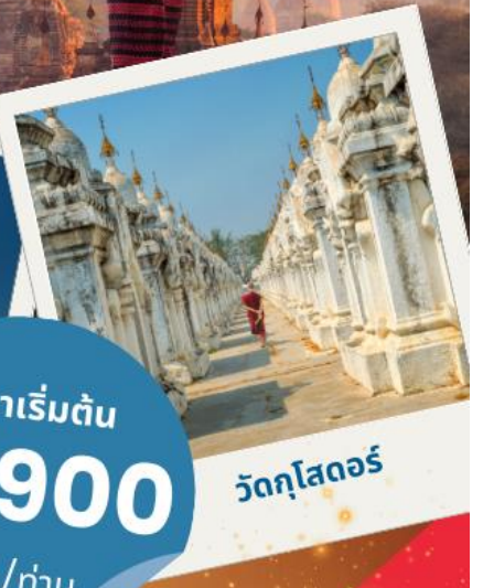
วัดกุโสตร์