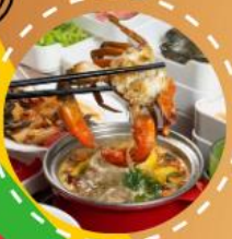
ชาบู ปูเฟ็ด