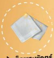
ผ้าเช็ดพระพักตร์