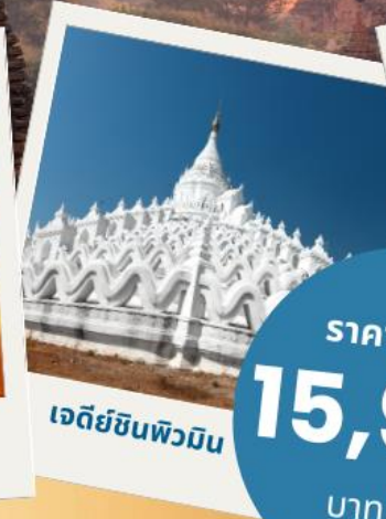
เจดีย์ชินพิวมิน