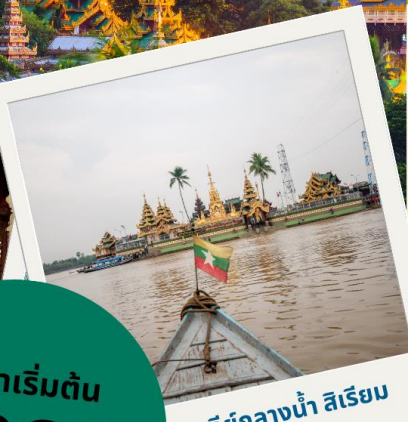
เจดีย์กลางน้ำ สิริเยม