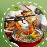
ชาบู บุฟเฟต์