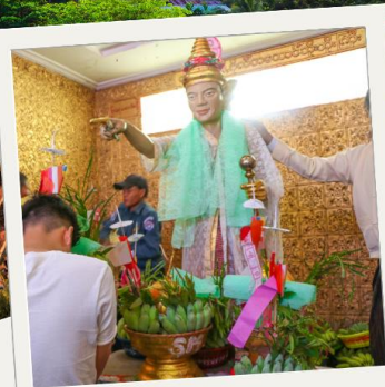
เทพทันใจ