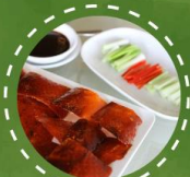
เปิดปักกิ่ง