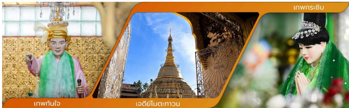
เทพทันใจ