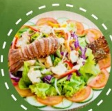
สลัดกุ้งมังกร