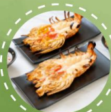
กุ้งแม่น้ำเผา