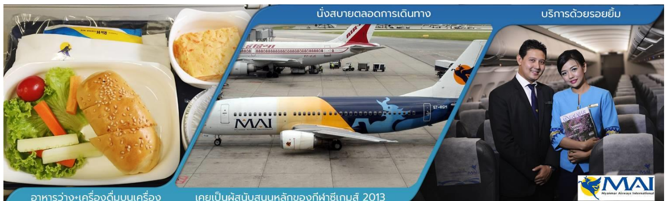
อาหารว่าง+เครื่องดื่มบนเครื่อง

07.30 น. คณะพร้อมกัน ณ สนามบินสุวรรณภูมิ อาคารผู้โดยสารขาออก ชั้น 4 ประตู 6 สายการบิน เมียนมาร์ แอร์เวย์ (8M) เคทเตอร์ N1-4 เจ้าหน้าที่บริษัทฯ คอยอำนวยความสะดวกในการออกบัตรที่หนึ่ง