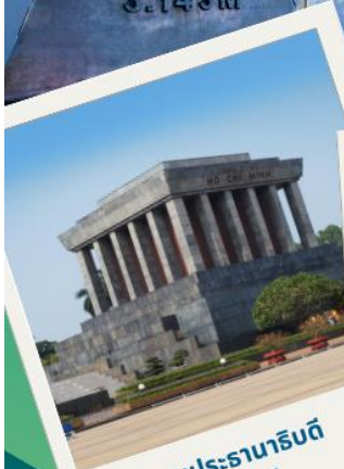
สุสานประธานาธิบดี โฮจิมินห์