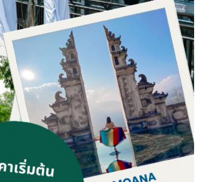
MOANA SAPA CAFE'