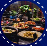
บุฟเฟ่ต์ อาหารนานาชาติ

*เงื่อนไขเป็นไปตามที่บริษัทกำหนดเท่านั้น