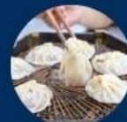
เกี้ยวซีอาน