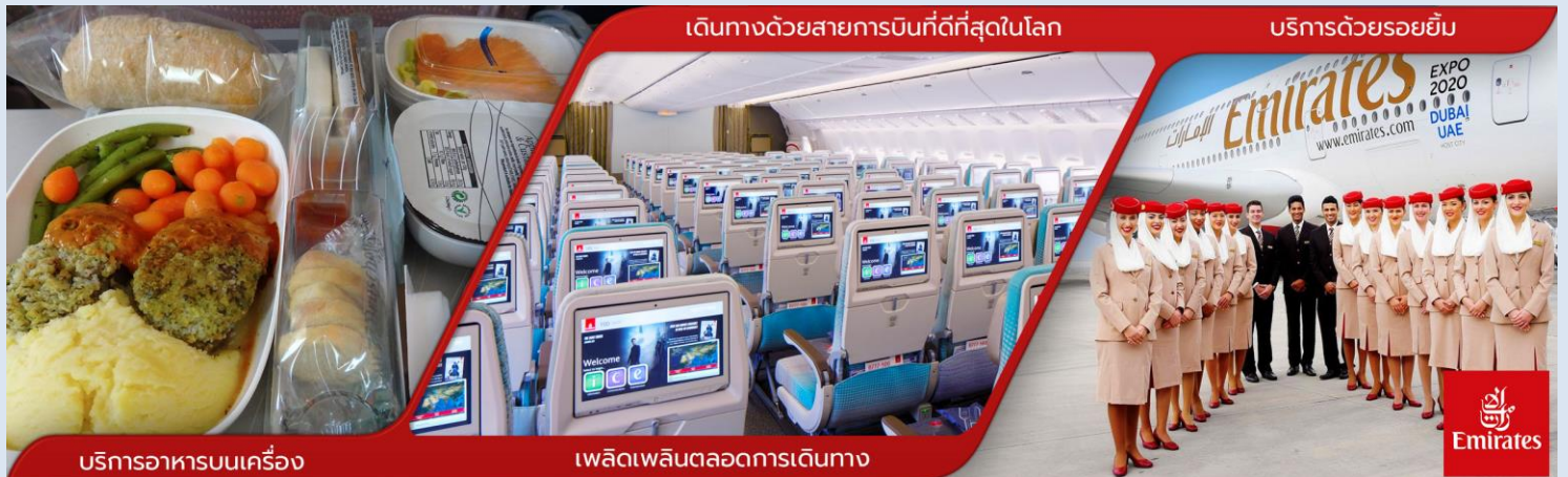
เดินทางด้วยสายการบินที่ดีที่สุดในโลก

02.50 น. ✈️ ออกเดินทางสู่ สนามบิน BKK-DXB ท่าอากาศยานนานาชาติดูไบ โดยสายการบินเอมิเรตส์ Emirates EK เที่ยวบินที่ EK377 // EK371 : 03.30-07.15 (ใช้เวลาเดินทาง 7 ชั่วโมง) (บริการอาหารและเครื่องดื่มบนเครื่อง)