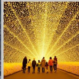
"NABANA NO SATO"