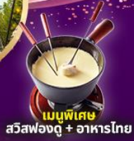
เมนูพิเศษ สวิสฟองดู + อาหารไทย

เมืองมอเทอโร ปราสาทซิลยอง เวเวย์ รูปปั้นชาร์ลี แชปลิน อินเตอร์ลาเคน ลูเซิร์น สะพานไม้ชาเปล สิงโตสะอัน น้ำตกโรนน์ หมู่บ้านอิเซลทวอลด์ ทะเลสาบเบรียนซ์ ซูริก