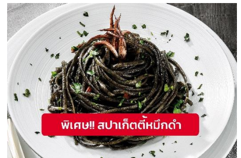
พิเศษ!! สปาเก็ตตีหมีกดำ

สปาเก็ตตีผัดซอสหมีกดำที่คลุกเคล้ากับความหอม กับ บรรยากาศสุด คลาสสิควับอิตาลีเลียนตำรับเวนิส