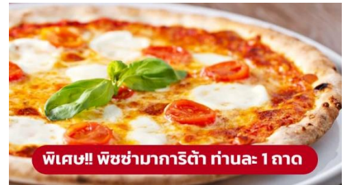
พิเศษ!! พิซซ่ามาการิตต้า ท่านละ 1 ถาด

☑️ รับประทานอาหารเที่ยง (มื้อที่1) เมนูพิเศษ!! พิซซ่ามาการิตต้า นำท่านเดินทางสู่ เมืองเวนิสเมสเตร (Venice Mestre) (ระยะทาง 264 กม. / 4 ชม.) เป็นย่านเมืองเก่าแก่ที่มีความสวยงามและแสดงให้เห็นถึงความเป็นอิตาลีขนานแท้