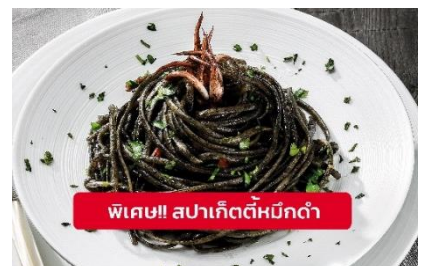
พิเศษ!! สปาเก็ตตี้หมึกดำ

เที่ยง ๑๑ รับประทานอาหารเที่ยง (มื้อที่4) เมนูพิเศษ!! สปาเก็ตตี้หมึกดำ