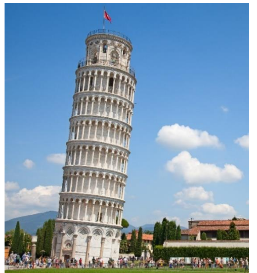
Highlight ! หอเอนปีซ่าเคยเป็นสถานที่กาลิเลโอมาพิสูจน์เรื่องแรงโน้มถ่วงของโลก

นำท่านเก็บภาพความประทับใจและถ่ายรูป 1 ใน 7 สิ่งมหัศจรรย์ของโลก หอเอนปีซ่า (Leaning Tower of Pisa) หอเอนปีซ่าที่สร้างขึ้นเพื่อเป็นหอรระวังแห่งวิหารประจำเมือง แต่เพียงการเริ่มต้นของการสร้างถึงบริเวณชั้น 3 ก็เกิดการทรุดตัวและต้องหยุดการก่อสร้างจนถัดมาอีก 100 ปี ถึงได้สร้างต่อจนเสร็จสมบูรณ์ มหาวิหารปีซ่า (Cathedral of Pisa)