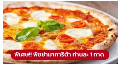
พิเศษ!! พิซซ่ามาริตต้า ท่านละ 1 ถาด

จากนั้นนำท่านเดินทางสู่ เมืองปีซ่า (Pisa) (ระยะทาง 356 กม. / 5.15 ชม.) เป็นเมืองที่เป็นที่รู้จักอย่างดีเกี่ยวกับ หอเอนเมืองปีซ่า ซากโบราณวัตถุของเมืองที่ยังหลงเหลือจากศตวรรษที่5 ก่อนคริสตกาล