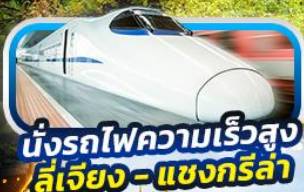
นั่งรถไฟความเร็วสูง ลี่เจียง - แชนกรีล่า