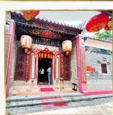
วัดแชกง โอซุง