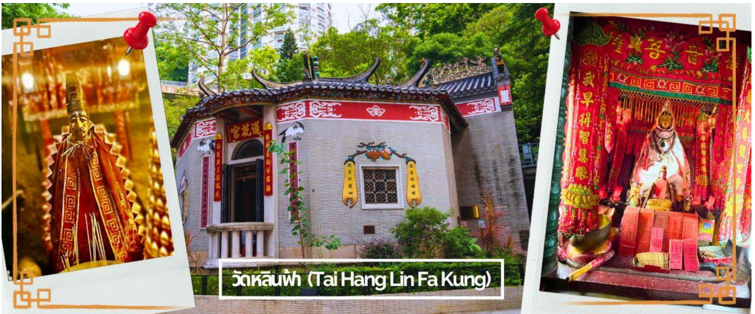
วัดหลินฟ้า (Tai Hang Lin Fa Kung)

จากนั้นนำท่านเดินทางสู่ วัดหลินฟ้า (LIN FA KUNG TEMPLE) หรือ วัดดอกบัว เป็นวัดจีนตั้งอยู่บริเวณหว่านจ่าย คอสเวย์เบย์ มีเจ้าแม่กวนอิม เป็นองค์ประธานของวัด สร้างขึ้นในปี 1863 มีตำนานเล่าว่าเจ้าแม่กวนอิมเคยปรากฏกายที่วัดแห่งนี้ เป็นที่เลื่อมใสของชาวบ้าน จึงร่วมใจกันสร้างวิหารลักษณะคล้ายดอกบัวนี้ขึ้น และประดับด้วยโคมไฟดอกบัวร้อยโคม เมื่อมองเข้าไปด้านในวิหารจะทำให้รู้สึกถึงความเจริญรุ่งเรือง เปรียบเสมือนว่าแค่มาไหว้เจ้าแม่กวนอิมที่วัดแห่งนี้ก็จะทำให้ผู้มาเยือนได้มีวิدتที่เจริญรุ่งเรืองยิ่งๆขึ้นไป และยังมี เทพเจ้าสาวจื่อเอี๊ยะ (เทพเจ้าสายนรก) เป็นเทพที่ขึ้นชื่อเรื่องความกตัญญู และด้านเงินทอง ผู้ใดที่ได้ไปไหว้ขอพรท่าน เชื่อว่าจะทำให้มีโชคลาภแบบไม่คาดคิด และสมหวังอย่างรวดเร็ว ใครที่ชอบเสี่ยงโชค เสี่ยงดวง ห้ามพลาดเลยที่เดียว