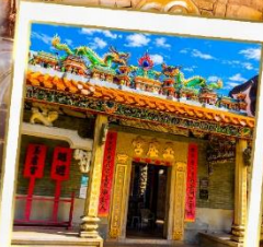
วัดศุกอซุย (วัดปักไต้)