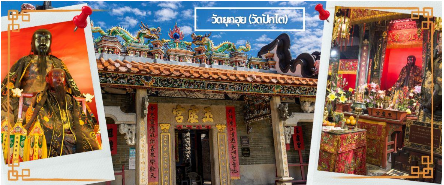
วัดกุสุย (วัดปึกโต)

จากนั้นนำท่านเดินทางสู่ วัดหลินฟ้า (LIN FA KUNG TEMPLE) หรือ วัดดอกบัว เป็นวัดจีนตั้งอยู่บริเวณหว่านจ่าย คอสเวย์เบย์ มีเจ้าแม่กวนอิม เป็นองค์ประธานของวัด สร้างขึ้นในปี 1863 มีตำนานเล่าว่าเจ้าแม่กวนอิมเคยปรากฏกายที่วัดแห่งนี้ เป็นที่เลื่อมใสของชาวบ้าน จึงร่วมใจกันสร้างวิหารลักษณะคล้ายดอกบัวนี้ขึ้น และประดับด้วยโคมไฟดอกบัวร้อยโคม เมื่อมองเข้าไปด้านในวิหารจะทำให้รู้สึกถึงความเจริญรุ่งเรือง เปรียบเสมือนว่าแค่มาไหว้เจ้าแม่กวนอิมที่วัดแห่งนี้ก็จะทำให้ผู้มาเยือนได้มีวิدتที่เจริญรุ่งเรืองยิ่งๆขึ้นไป และยังมี เทพเจ้าสาวจื่อเอี๊ยะ (เทพเจ้าสายนรก) เป็นเทพที่ขึ้นชื่อเรื่องความกตัญญู และด้านเงินทอง ผู้ใดที่ได้ไปไหว้ขอพรท่าน เชื่อว่าจะทำให้มีโชคลาภแบบไม่คาดคิด และสมหวังอย่างรวดเร็ว ใครที่ชอบเสี่ยงโชค เสี่ยงดวง ห้ามพลาดเลยที่เดียว