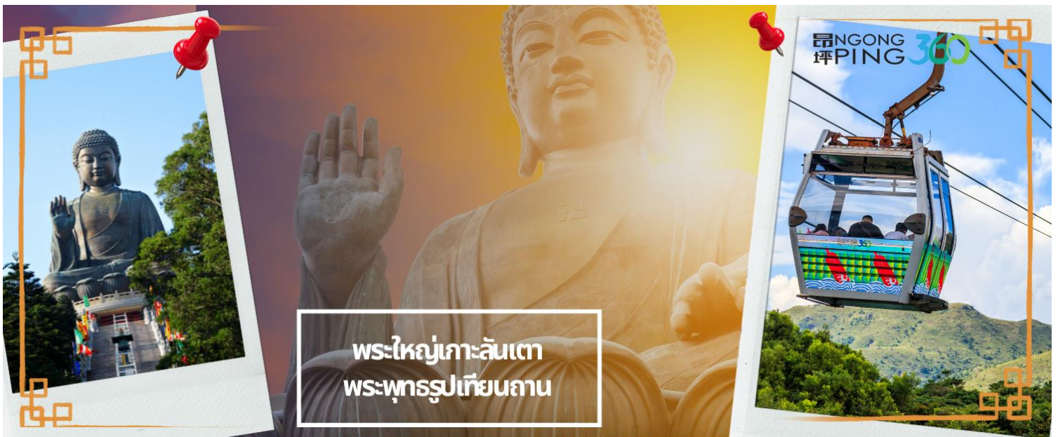
พระใหญ่เกาะลันเตา พระพุทธรูปเทียนถ่าน

จากนั้นเดินทางสู่เกาะลันเตา เพื่อไปที่สถานีตุงซุง ท่านจะได้สัมผัสกับประสบการณ์ที่น่าตื่นตาตื่นใจจาก กระเช้าลอยฟ้าฮ่องกง (NGONG PING SKYRAIL 360 **STANDARD CABIN**) ซึ่งถือได้ว่าเป็นแหล่งท่องเที่ยวอันมีเอกลักษณ์ระดับโลกของฮ่องกง ที่มีระยะทางกว่า 5.7 กิโลเมตร ใช้เวลาประมาณ 25 นาที ท่านจะได้สัมผัสบรรยากาศจากบนกระเช้ามุมสูง เส้นทางกระเช้าเชื่อมจากใจกลางเมืองตุงซุง ถึง หมู่บ้านวัฒนธรรมนองปิง บนเกาะลันเตา ท่านจะได้ชมวิวแบบพาโนรามา 360 องศา ของสนามบินนานาชาติฮ่องกง ทิวทัศน์เหนือท้องทะเลของทะเลจีนใต้ ชมวิวของเนินเขาอันเขียวขจี น้ำตก ลำธาร และป่าอันเขียวชอุ่มของอุทยานบนเกาะลันเตาเหนือ (**กรณีกระเช้านองปิง 360 มีการปิดซ่อมบำรุง หรือ มีการปิดเนื่องจากสภาพอากาศแปรปรวน ทางบริษัทฯ ขอสงวนสิทธิ์ในการเปลี่ยนเป็นใช้รถโค้ชของทางอุทยานในการเดินทาง เพื่อนำท่านขึ้นสู่หมู่บ้านวัฒนธรรมนองปิง บนเกาะลันเตาแทน**) จากนั้นนำท่านไปสักการะ พระใหญ่เกาะลันเตา หรือ พระพุทธรูป