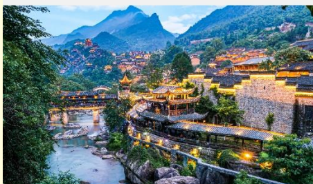
หุบเขาเทวดาฉางเซี่ยนกู่