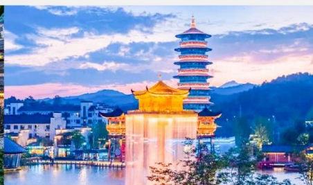
ล่องเรือชมแสงสียามค่ำคืนอู๋หนี่โจว