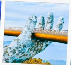
บ้านน้ำฮิลล์