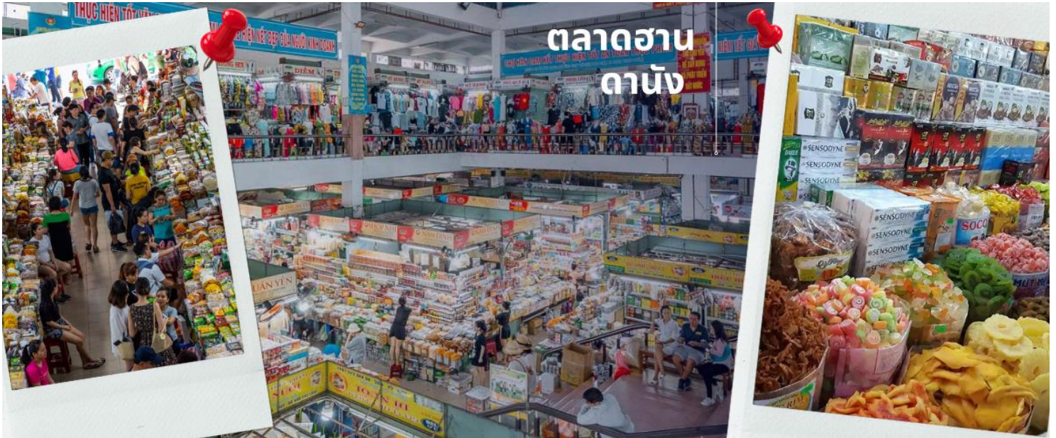
ตลาดฮาน ดานัง

นำท่านไปละลายทรัพย์ที่ ตลาดฮาน เป็นตลาดที่รวบรวมสินค้ามากมายเป็นที่นิยมทั้งชาวเวียดนามและชาวไทย อาทิ เสื้อเวียดนาม หมวก รองเท้า กระเป๋า สินค้าพื้นเมือง โดยเฉพาะงานฝีมือ อาทิ ภาพผ้าปักมืออันวิจิตร โคมไฟ ผ้าปัก กระเป๋าปัก ตะเกียบไม้แกะสลัก ชุดอ่าวหาย่าย(ชุดประจำชาติเวียดนาม) ไว้เป็นที่ระลึกมากมายเพื่อฝากคนที่บ้าน