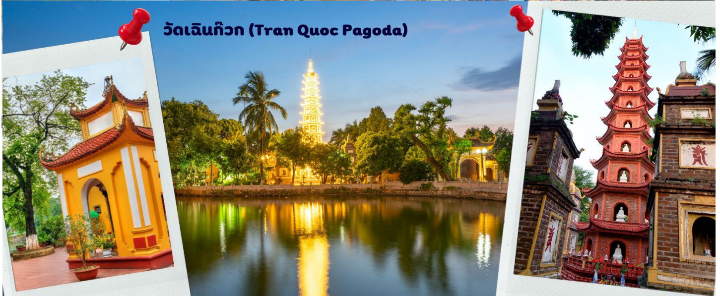
วัดเจินก๊วก (Tran Quoc Pagoda)

จากนั้นให้ท่านได้ อิสระช้อปปิ้ง ถนนสาย 36 street แหล่งช้อปปิ้งของसानอย มีต้นไม้ปกคลุมสองฝั่งถนน สาเหตุที่ชื่อถนน 36 มาจาก 36 อาชีพที่ทำการค้าขายบนถนนแห่งนี้ ตั้งแต่อดีตอย่างงานด้านหัตถกรรมสอดคล้องกับชื่อถนนแต่ละเส้น ในอดีตอย่างเช่น ถนนเครื่องเงิน ถนนผ้าไหม แต่ปัจจุบันมากกว่า 36 ไปแล้ว ที่นี้จะเป็นแหล่ง Shopping มีสินค้าหลากหลายชนิด ร้านขายชุดกีฬาให้เลือกมากมาย เนื่องด้วย เวียดนามเอง เป็นฐานการผลิตสินค้าของ แบรนด์ที่มีชื่อเสียงของโลกมากมาย