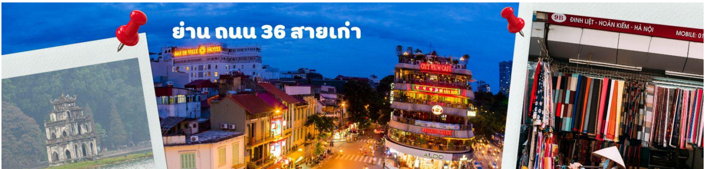
ย่าน ถนน 36 สายเก่า

จากนั้นนำท่านไป ทะเลสาบคินดาบ มีทะเลสาบน้ำสีเขียวอยู่ที่ใจกลางเมืองसानอย ทะเลสาบน้ำจืดแห่งนี้ชื่อฮว่านเกี่ยม แปลว่า ทะเลสาบคินดาบ มีตำนานเล่าต่อกันมาว่า ในศตวรรษที่ 15 จักรพรรดิจักรพรรดิเล หล่ย (Le Loi) ได้รับดาบวิเศษจากสวรรค์และใช้ดาบนั้นต่อสู้กับกองทัพจีนจนได้รับเอกราช หลังจากนั้นวันหนึ่ง จักรพรรดิได้ลงเรือล่องไปในทะเลสาบพร้อมกับดาบ มีเต้ายักษ์ขึ้นมารับดาบวิเศษแล้วดำลงสู่ใต้น้ำหายไป จึงเป็นที่มาของชื่อทะเลสาบกลางเมืองसानอย