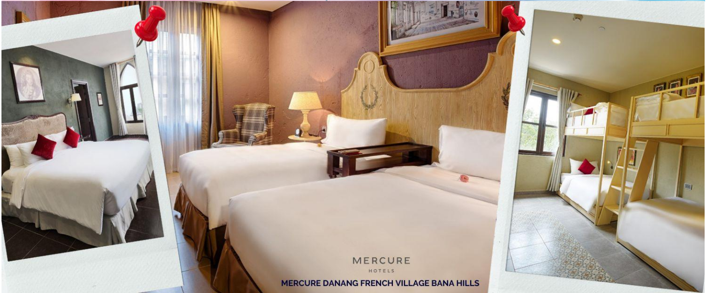
MERCURE HOTELS MERCURE DANANG FRENCH VILLAGE BANA HILLS

วันสี่ บาน่าฮิลล์ - ดานัง - โบสถ์สีชมพู - ตลาดฮาน - สนามบินดานัง - สุวรรณภูมิ