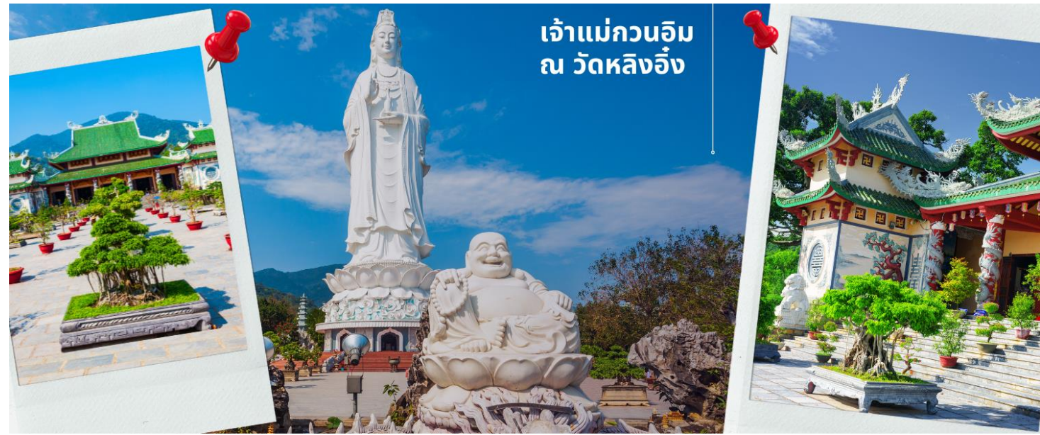
เจ้าแม่กวนอิม ณ วัดหลิงอิ่ง

เช้า รับประทานอาหารเช้า ที่ โรงแรม (2) นำท่านมัศจรรย์องค์ เจ้าแม่กวนอิม ณ วัดหลิงอิ่ง อยู่บนเกาะเซินตรา (Son Tra) ทางเหนือของเมืองดานัง เป็นวัดใหญ่ที่สุดของที่นี่ รูปปั้นปูนขาวของเจ้าแม่กวนอิมยืนหันหลังให้ภูเขา หันหน้าออกสู่ทะเลเพื่อเป็นการปกป้องคุ้มครองชาวประมงที่ออกไปหาปลา เสียงระฆังวัดที่ตีประสานกับเสียงคลื่นนั้นช่วยให้ชาวเรือรู้สึกสงบ