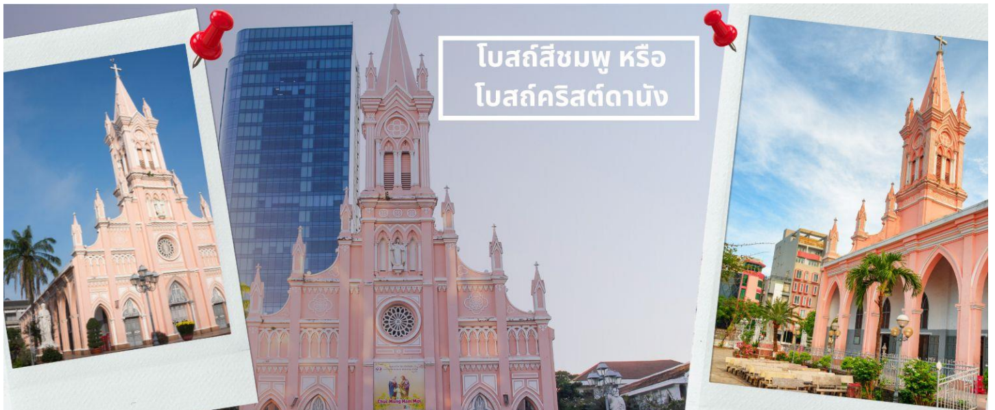
โบสถ์สีชมพู หรือ โบสถ์คริสต์ดานัง

จากนั้นนำท่านไป โบสถ์สีชมพู หรือ โบสถ์คริสต์ดานัง (Danang Cathedral) เป็นโบสถ์ที่มีความสำคัญ เนื่องจากเป็นจุดเริ่มต้นของศาสนาคริสต์ในเวียดนาม สร้างขึ้นในสมัยที่เวียดนามตกเป็นอาณานิคมของฝรั่งเศสเป็นสถาปัตยกรรมในสไตล์โกธิก พร้อมด้วยการตกแต่งอย่างสวยงามประณีต ที่สำคัญคือเป็นโบสถ์สีชมพูพาสเทลทั้งหลัง ตัดขอบด้วยสีขาว ดูละมุนตาสุดๆ