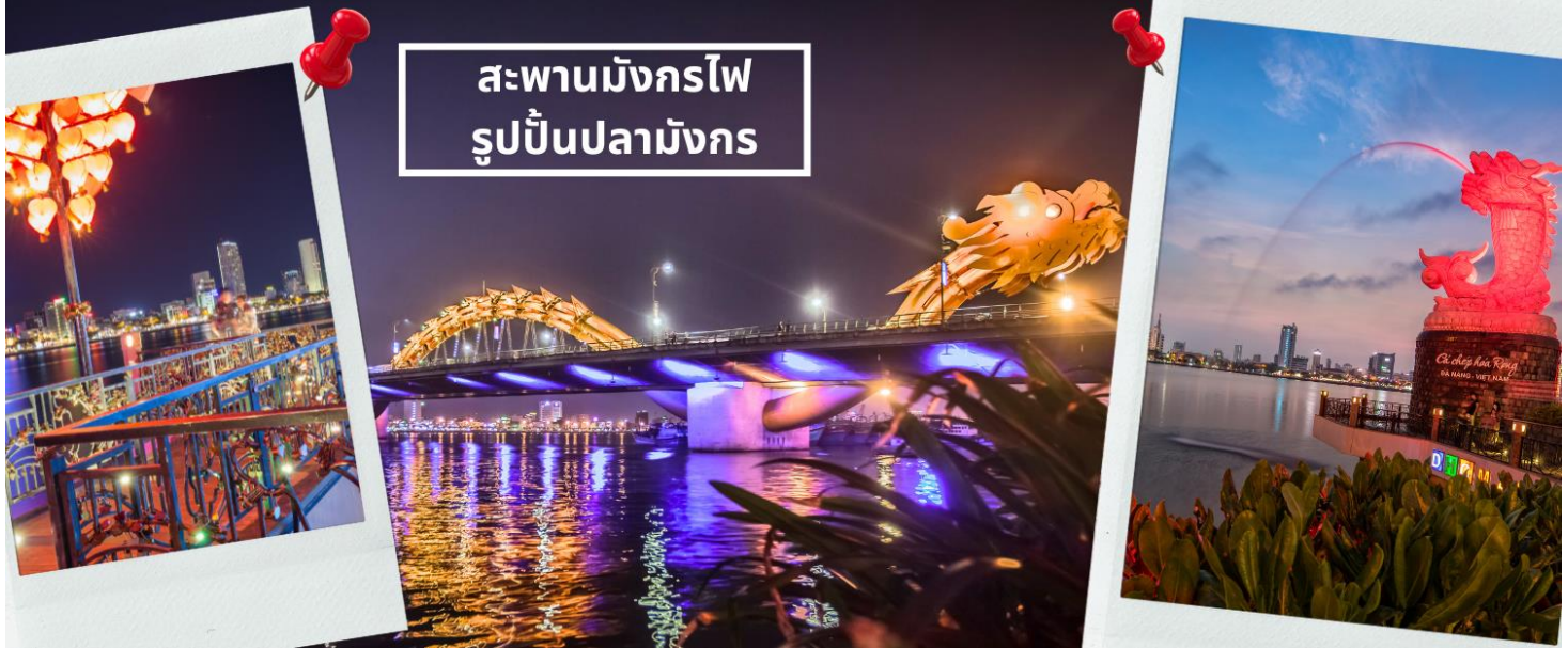
สะพานมังกรไฟ รูปปั้นปลามังกร

จากนั้นนำท่านชม สะพานแห่งความรัก ที่นิยมของหนุ่มสาวคู่รักกันมาซื้อกุญแจใส่คล้องใส่สะพาน จากนั้นนำท่านชม รูปปั้นปลามังกร ที่เป็นสัญลักษณ์ของเมืองดานัง เมืองที่กำลังจากปลากลายเป็นมังกรในระยะใกล้ เชิญท่านเพลิดเพลินกับความอลังการของ สะพานมังกรไฟ ที่มีความยาวถึง 666 เมตร เป็นสะพาน 6 เลนส์ ซึ่งเป็นสะพานที่ตระการตามากที่สุดของเวียดนามในเวลานี้โดยการแสดงนี้จะเริ่มเวลา 21.000น. ของวันเสาร์และอาทิตย์เท่านั้น