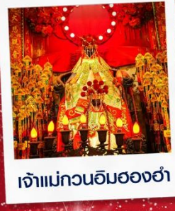
เจ้าแม่กวนอิมสองฮ่า