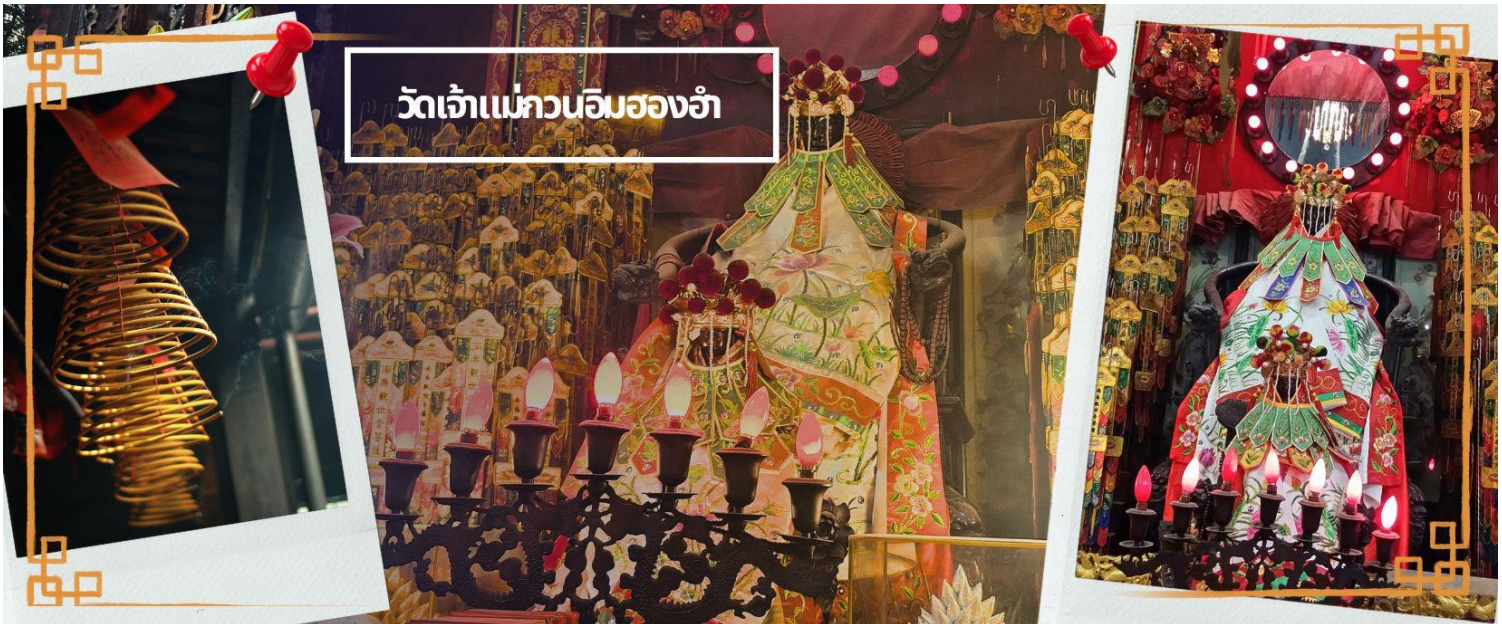
วัดเจ้าแม่กวนอิมสองฮ้า

จากนั้นนำทุกท่านเดินทางสู่ วัดเจ้าแม่กวนอิมสองฮ้า (HUNG HOM KWUN YUM TEMPLE) เป็นหนึ่งในวัดที่ชาวฮ่องกงนั้นเลื่อมใสกันมาก ด้วยความที่เจ้าแม่กวนอิมนั้นเป็นเทพเจ้าแห่งความเมตตา ฉะนั้นเมื่อใครมีทุกข์ร้อนอะไรก็มักจะมากราบไหว้ขอพรให้เจ้าแม่ช่วยเหลือ วัดนี้ถูกสร้างขึ้นในปี ค.ศ. 1873 ในช่วงสงครามโลกครั้งที่ 2 มีการปล่อยระเบิดลงบริเวณวัดสองฮ้าหลายต่อหลายครั้ง ทำให้มีผู้บาดเจ็บและล้มตายมากมาย แต่ชาวบ้านที่หนีเข้าไปหลบภัยในวัดนี้ก็กลับปลอดภัยและตัววัดก็ไม่ได้รับความเสียหายจากเหตุการณ์ทั้งระเบิดอย่างน่าอัศจรรย์ และวันสำคัญอีกวันหนึ่งที่คนหลังไหลมาไหว้ขอพรอย่างไม่ขาดสาย และรอคอยเป็นประจำทุกปี ก็คือ "วันเปิดทรัพย์" หรือ วันยืมเงินเทพเจ้า เป็นวันที่จะมาขอพรและยืมเงินเจ้าแม่กวนอิม ซึ่งตรงกับวันที่ 26 นับจาก