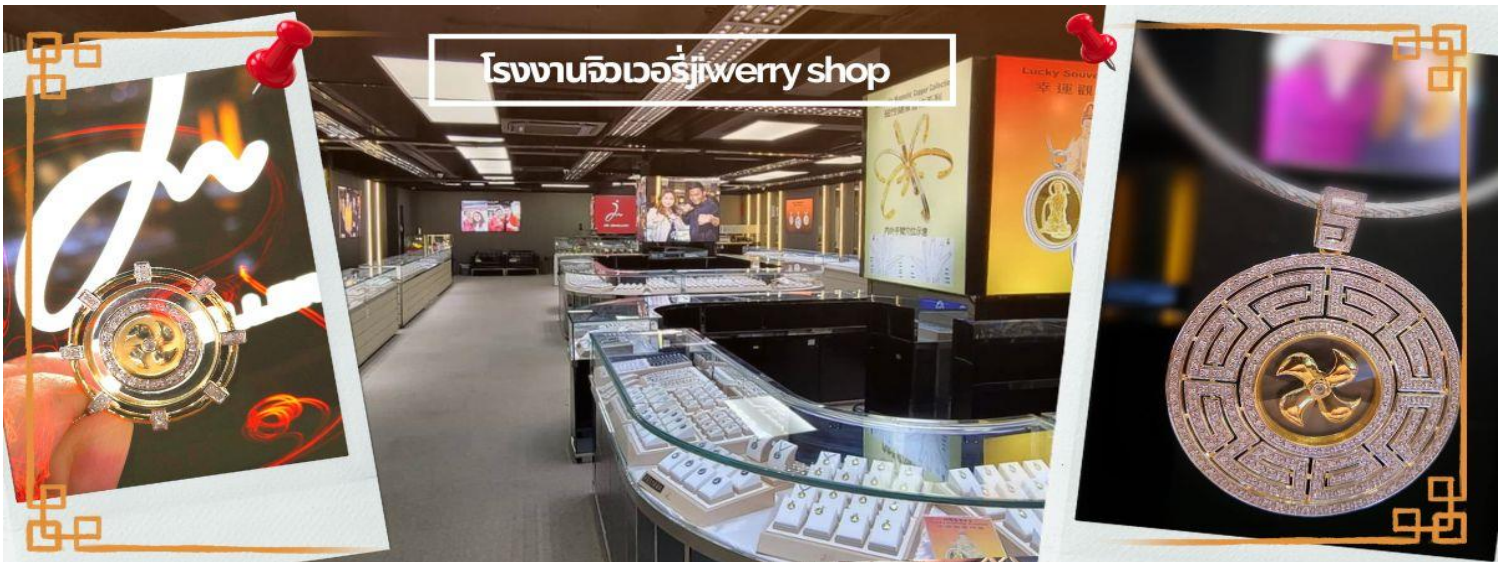
โรงงานจิวเวลรี่ jewelry shop

วันตรุษจีน ซึ่งพิธีนี้ใน 1 ปี มีเพียงครั้งเดียวเท่านั้นจากนั้น จากนั้นนำท่านชม โรงงานจิวเวลรี่ ซึ่งเป็นโรงงานที่มีชื่อเสียงที่สุดของฮ่องกงในเรื่องการออกแบบเครื่องประดับ อาทิเช่น จี้ และแหวนกำหั้น ที่สวยงามโดดเด่นไม่เหมือนใคร ซึ่งถือกำเนิดขึ้นที่นี่และมีชื่อเสียงที่สุดใช้เป็นเครื่องประดับติดตัว และเสริมดวงชะตา สินค้าทุกชิ้นมีเอกสารรับประกันคุณภาพเปลี่ยน ซ่อม ใต้ตลอดอายุการใช้งาน หากเกิดการชำรุดจากสินค้าไม่ใช่อุบัติเหตุ และ