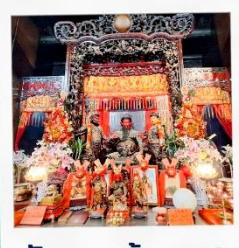
วัดเทพเจ้ากวนอู