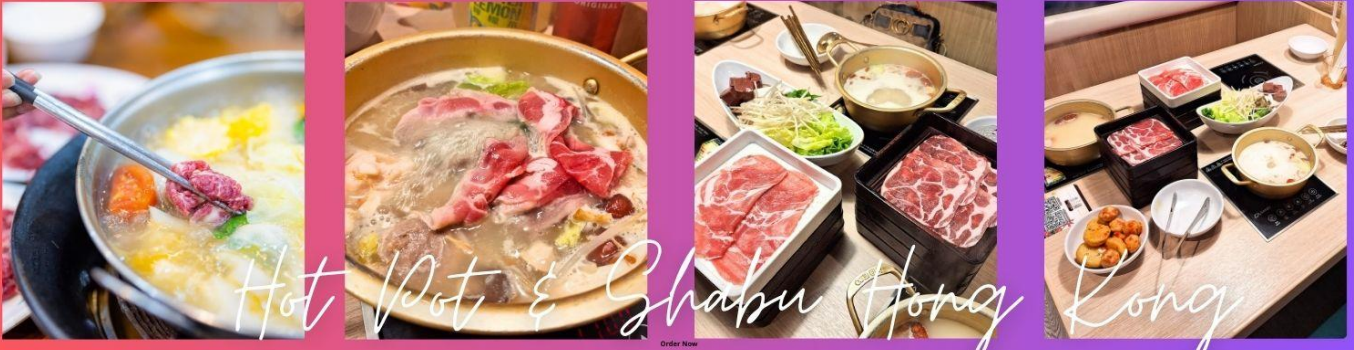
พิเศษเมนูชาบู สไตส์ฮ่องกง