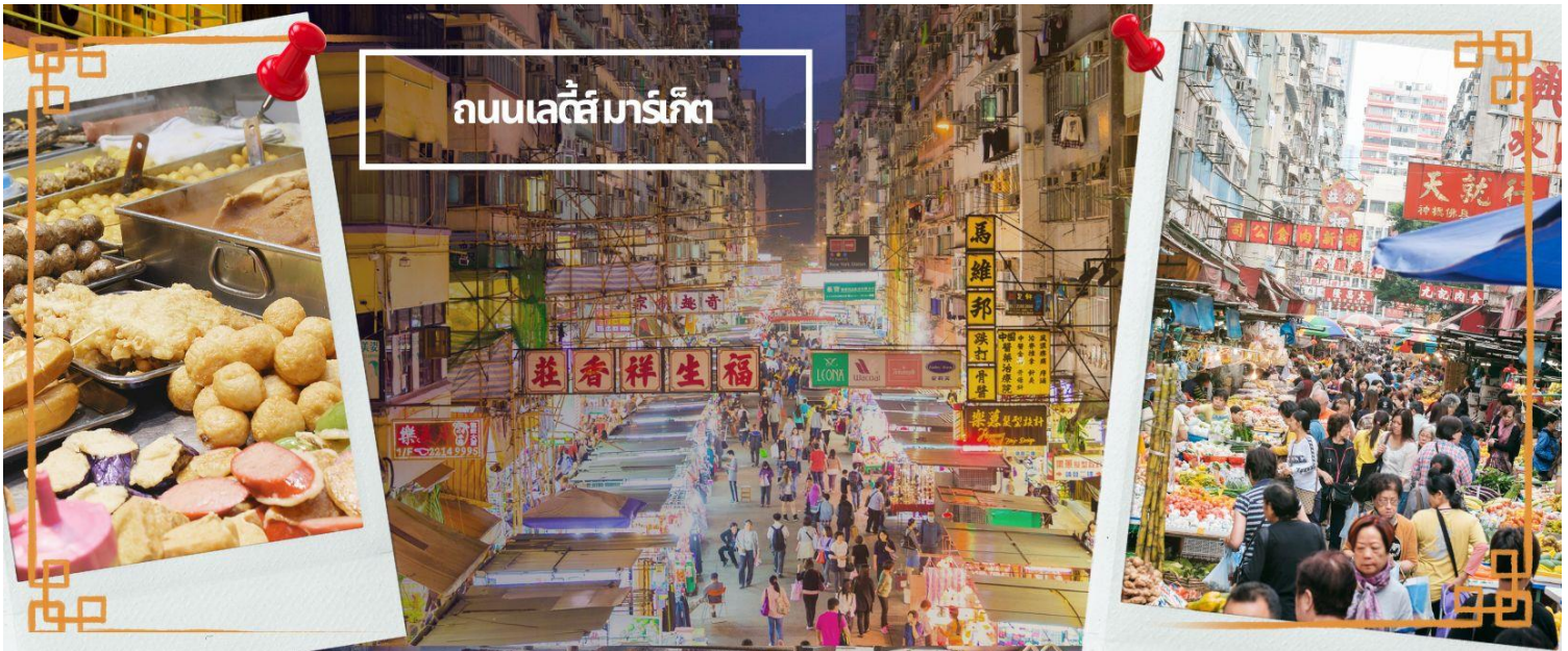
ถนนเลดี้ส์ มาร์เก็ต

จากนั้นนำท่านเดินทางสู่ ย่านมงก๊ก เป็นย่านที่มีความคึกคักที่สุดแห่งหนึ่งในเกาะฮ่องกงก็ว่าได้ เป็นสวรรค์ของนักช้อปปิ้งหนึ่งที่ สายช้อปปะพลาดไม่ได้ นับได้ว่าเป็นย่านช้อปปิ้งที่คึกคักมากอีกแห่งหนึ่งของฮ่องกงเพราะเป็นย่านช้อปปิ้งที่มีทั้งร้านค้า และคนที่มาช้อปปิ้งจากที่ต่างๆ มากมายไม่ขาดสายตั้งแต่กลางวันยันกลางคืน เป็นถนนช้อปปิ้งที่มีสีสันมาก ถ้าเทียบกับญี่ปุ่นแล้วก็เปรียบเหมือนการเดินทางอยู่ที่ชิบูย่าเลยก็ว่าได้ และยังมี ถนนเลดี้ส์ มาร์เก็ต (LADIES MARKET) ที่มีทั้งเครื่องสำอาง เสื้อผ้า รองเท้า กระเป๋า เครื่องประดับมากมายให้เลือกช้อป อีกทั้งยังมีร้านอาหารและเครื่องดื่ม ที่ขึ้นชื่อหลากหลายชนิด ให้ทุกท่านได้ลองลิ้มรสอีกมากมาย