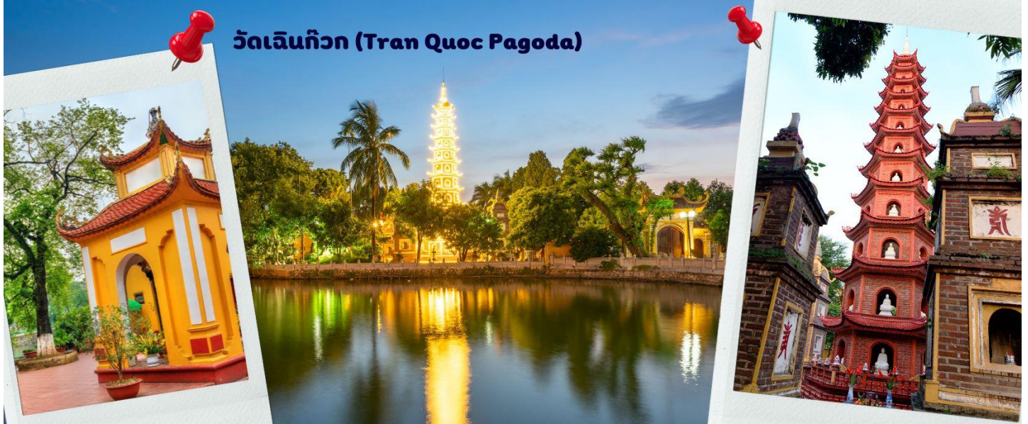
วัดเจ็ญก๊วก (Tran Quoc Pagoda)

จากนั้นนำท่านไป วัดเจ็ญก๊วก (Tran Quoc Pagoda) เป็นวัดที่อยู่ใจกลางเมืองของเวียดนาม ใกล้ชิดกับทะเลสาบตะวันตกของเมืองฮานอย สร้างด้วยสถาปัตยกรรมจีนโบราณ มีความร่มรื่น และบรรยากาศดี จึงเป็นที่นิยมของนักท่องเที่ยวทั้งที่ชื่นชอบความงามและมีศรัทธาในพระพุทธศาสนา จากภาพมุมสูงของสถานที่ตั้ง ที่นี่เหมือนตั้งอยู่บนเกาะที่ยื่นลงไปในทะเลสาบ แต่มีเส้นทางคมนาคมเข้าถึงที่ สิ่งปลูกสร้างมีการวางผังเป็นอย่างดี ใช้สีสันทึกลมกลืนในโทนสีเหลือง น้ำตาล ตัดกับสีเขียวของต้นไม้ใหญ่ที่โอบล้อมอยู่ ในมุมถ่ายภาพจากอีกฝั่งหนึ่ง จะเห็นสิ่งปลูกสร้างสไตล์จีน และเจดีย์หลายชั้นโดดเด่น มีภาพที่สะท้อนลงสู่ผืนน้ำ เป็นภูมิทัศน์ที่งดงามทั้งยามกลางวันและยามค่ำคืนที่มีการเปิดไฟส่องสว่าง