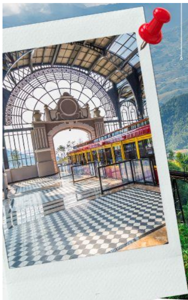
นั่งรถไฟชมเมืองซาปา

นำท่าน นั่งรถไฟชมเมืองซาปา (รวมค่ารถไฟชมเมือง) ท่านจะได้พบกับวิวทิวทัศน์ของเมืองซาปาที่เต็มไปด้วยความสดชื่น และสุดกลิ่นอายธรรมชาติ และยังตื่นตาไปด้วยวิวกุเขา และนาขั้นบันได ที่มีชื่อเสียงของเมืองซาปาอีกด้วย ความยาวประมาณ 2 กิโลเมตร โดยใช้เวลาประมาณ 20 นาทีเพื่อไปสู่สถานีขึ้นกระเช้าที่จะนำท่านขึ้นสู่ยอดเขาฟานซีปัน