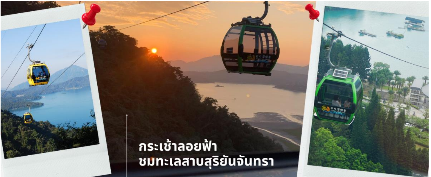
กระเช้าลอยฟ้า ชมทะเลสาบสุรียันจันทรา

จากนั้น เดินทางสู่ เมืองหนานโกว ตั้งอยู่ใจกลางของเกาะไต้หวัน โดยเป็นเมืองที่มีขนาดใหญ่ที่สุด และเป็นเมืองเดียวของไต้หวันที่ไม่ได้มีเขตติดต่อกับทะเล นอกจากนี้ที่นี่ยังเป็นที่ตั้งของยอดเขาวิซ่านหรือภูเขาหยกซึ่งเป็นภูเขาที่สูงที่สุดในไต้หวันพื้นเมือง จากนั้นแวะ ชิมชาอู่หลง และชมการสาธิตการชงชาแบบต่างๆ เพื่อให้ท่านได้ชงชาอย่างถูกวิธีและได้รับประโยชน์จากการดื่มชา ทั้งชาอู่หลงจากอาลีซาน ชาจากเมืองฮัวเหลียน และเลือกซื้อชาอู่หลงที่ขึ้นชื่อของไต้หวันไปเป็นของฝากและดื่มทานเอง เปิดประสบการณ์สุดพิเศษ กระเช้าลอยฟ้าชมทะเลสาบสุรียันจันทรา คุณสามารถนั่งกระเช้าลอยฟ้าเพื่อเข้าไปในสวนสนุกที่เต็มไปด้วยความสนุกสนาน เรียนรู้วัฒนธรรมจากหมู่บ้านวัฒนธรรมเก๋าชนเผ่า รวมถึงสัมผัสกับทิวทัศน์ทะเลสาบที่สวยงามจากมุมมองบนกระเช้า ถือเป็นประสบการณ์ที่หาได้ยาก ต้องสัมผัสด้วยตาคุณเอง ซึ่งเป็นหนึ่งในแลนด์มาร์คสำคัญ ไม่ว่าจะใครมาไต้หวันจะต้องแวะมาชมทัศนียภาพอันสวยงามของทะเลสาบแห่งนี้