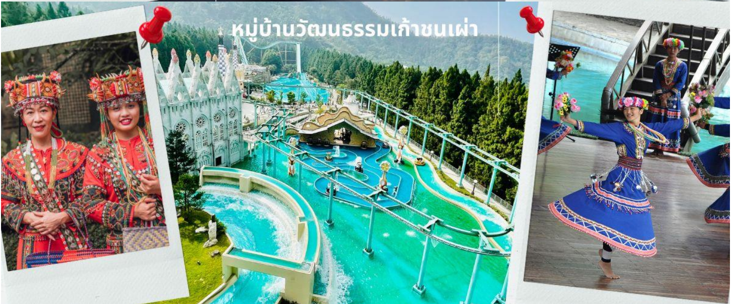
หมู่บ้านวัฒนธรรมเก๋าชนเผ่า

จากนั้นนำทุกท่านไปยัง หมู่บ้านวัฒนธรรมเก๋าชนเผ่า หมู่บ้านวัฒนธรรมเก๋าชนเผ่า ถูกสร้างขึ้นในปี 1986 มีพื้นที่ทั้งหมด 62 เฮกเตอร์ ตั้งอยู่ในเขตหนานโกว ใกล้ๆ กับทะเลสาบสุรียันจันทรา (Sun Moon Lake) ชนพื้นเมืองในหมู่บ้านนี้ มีความตั้งใจที่จะนำวัฒนธรรมชนเผ่าดั้งเดิม มาผสมผสานกับการท่องเที่ยวเชิงวัฒนธรรม เพื่อดึงดูดนักท่องเที่ยวเข้ามาสัมผัสกับประสบการณ์ใหม่ ใกล้ชิดกับชนพื้นเมืองดั้งเดิมของไต้หวัน ภายในหมู่บ้านวัฒนธรรมเก๋าชนเผ่า มี 5 จุดสำคัญ แบ่งเป็นสวนยุโรป (European Gardens) ตลาดนัดอลาดิน (Aladdin Plaza) หมู่บ้านชาวพื้นเมือง (the Aboriginal Villages) เกาะสวนสนุก และป่า