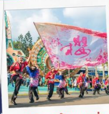
หมู่บ้านเก้าชุนเผ่า