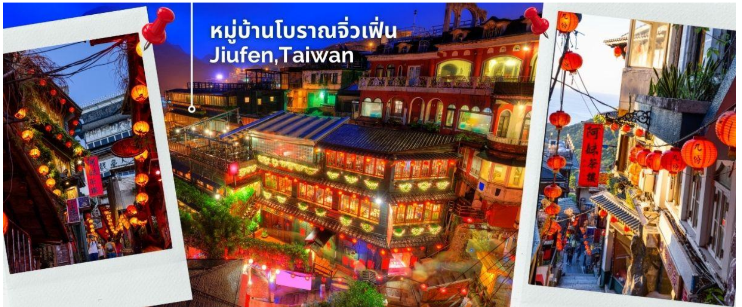
หมู่บ้านโบราณจิวเฟิน Jiufen, Taiwan

นำทุกท่านเดินทางไปสู่สัมผัสบรรยากาศ หมู่บ้านโบราณจิวเฟิน ที่ตั้งอยู่บริเวณไหล่เขาในเมืองจีหลง หมู่บ้านจิวเฟิน เคยเป็นแหล่งเหมืองทองที่มีชื่อเสียงตั้งแต่สมัยโบราณ ปัจจุบันเป็นสถานที่ท่องเที่ยวที่สำคัญแห่งหนึ่ง เพราะเป็นถนนคนเดินเก่าแก่ที่มีชื่อเสียงที่สุดในไต้หวัน ให้ท่านได้เพลิดเพลินบรรยากาศแบบดั้งเดิมของร้านค้า ร้านอาหารของชาวไต้หวันในอดีตและยังสามารถชื่นชมวิวทิวทัศน์รวมทั้งเลือกชิมและซื้อชาจากร้านค้าที่มีอยู่มากมายอีกด้วย *เสาร์-อาทิตย์ ต้องเปลี่ยนเป็นรถสาธารณะ