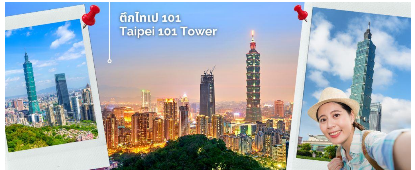
ตึกไทเป 101 Taipei 101 Tower

นำท่านแวะชมของที่ระลึก ผลิตภัณฑ์สร้อย Germanium ซึ่งทำเป็นเครื่องประดับทั้งสร้อยคอและสร้อยข้อมือซึ่งมีการฝังแร่ Germanium ลงไปมีคุณสมบัติ ลดผลกระทบจากรังสีจากอุปกรณ์อิเล็กทรอนิกส์ปรับความสมดุลในระบบต่างๆของร่างกาย จากนั้นนำท่านถ่ายรูปคู่ ตึกไทเป 101 ที่หมู่บ้านทหารชื่อชือฮั่นซุน หรือ Old Military Village เป็นหมู่บ้านโบราณแห่งแรกของประเทศไต้หวัน ตั้งอยู่ในเมืองไทเปใกล้