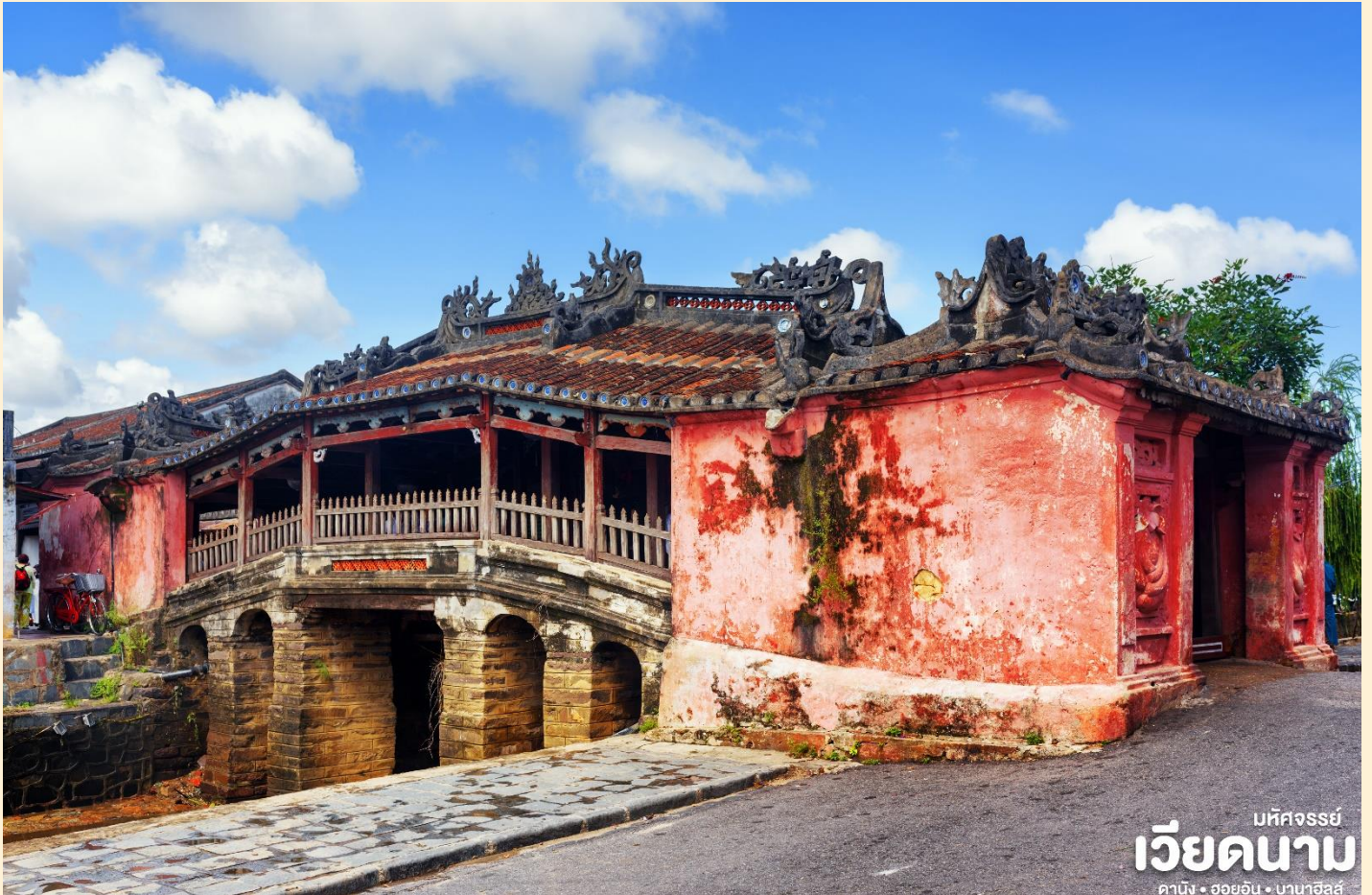
มหิศวรรษย์ เวียดนาม ดานัง • ฮอยอัน • บานาฮิลล์

สร้างโดยชุมชนชาวญี่ปุ่นเมื่อ 400 กว่าปีมาแล้ว กลางสะพานมีศาลเจ้าศักดิ์สิทธิ์ ที่สร้างขึ้นเพื่อ สวดส่งวิญญาณมังกร ชาวญี่ปุ่นเชื่อว่า มี มังกรอยู่ใต้พิภพส่วนตัวอยู่ที่อินเดียและหางอยู่ที่ญี่ปุ่น ส่วนลำตัวอยู่ที่เวียดนาม เมื่อใดที่มังกรพลิกตัวจะเกิดน้ำท่วมหรือแผ่นดินไหว ชาวญี่ปุ่นจึงสร้าง สะพานนี้โดยตอกเสาเข็มลงกลางลำตัวเพื่อกำจัดมันจะได้ไม่เกิดภัยพิบัติขึ้นอีก ชม ศาลกวางอู ซึ่งอยู่ บนสะพาน ญี่ปุ่นและที่ฮอยอันชาวบ้านจะนำสินค้าต่าง ๆ ไว้ที่หน้าบ้าน เพื่อขายให้แก่นักท่องเที่ยว ท่านสามารถซื้อของที่ระลึก เป็นของฝากกลับบ้านได้อีกด้วย เช่น กระเป๋าโคมไฟ เป็นต้น