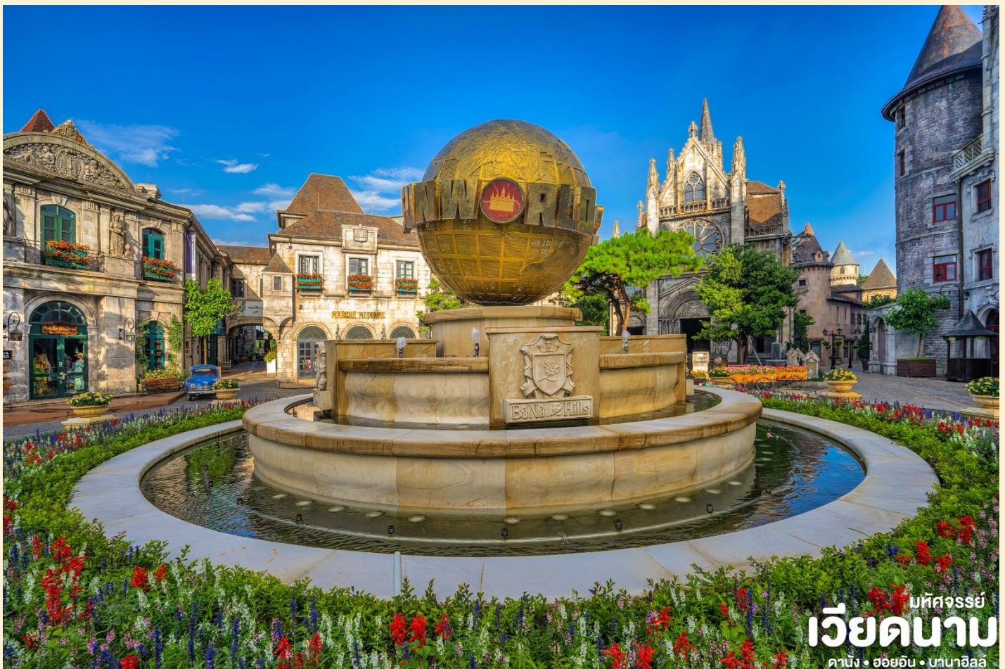
บริษัทจรรยา เวียดนาม ดานัง • ฮอยอัน • บานาฮิลล์