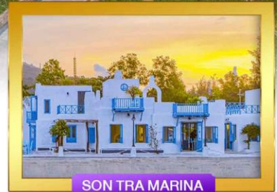
SON TRA MARINA