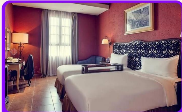
พักบนบานาฮิลล์ 1 คืน