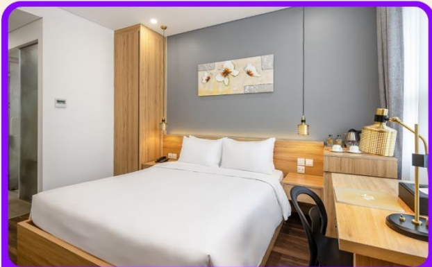
พักเมืองดานัง 4 ดาว 2 คืน