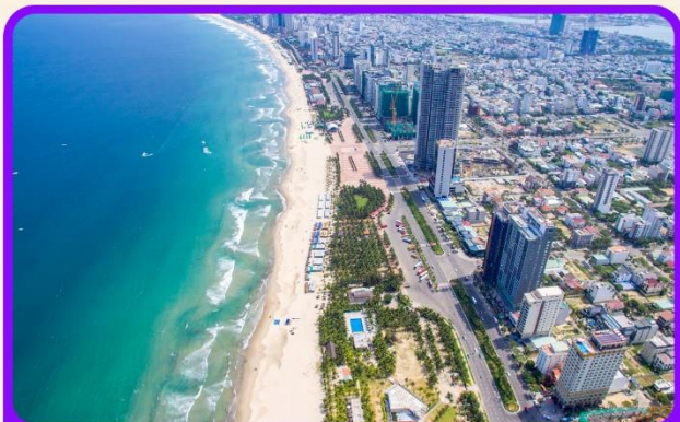
เช็किन ชายหาดหมีเคว เป็นชายหาดที่สวยงามที่สุดในเมืองดานัง