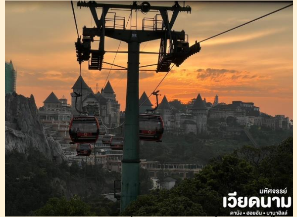
บริษัทจรรยา เวียดนาม ดานัง • ฮอยอัน • บานาฮิลล์

นั่งกระเช้าขึ้นสู่บานาฮิลล์ กระเช้าแห่งบานาฮิลล์ นี้ได้รับการบันทึกสถิติโลกโดยWorld Record ว่า เป็นกระเช้าไฟฟ้าที่ยาวที่สุด ประเภท Non Stop โดยไม่หยุดแวะมีความยาวทั้งสิ้น 5,042 เมตร และเป็นกระเช้าที่สูงที่สุด 1,294 เมตร นักท่องเที่ยวจะได้สัมผัสบรรยากาศและบางจุด มีเมฆลอยต่ำกว่ากระเช้าพร้อมอากาศบริสุทธิ์อัน สดชื่นจนทำให้ท่านอาจลืมไปเสียด้วยซ้ำว่าที่นี่ไม่ใช่ยุโรปเพราะอากาศที่หนาวเย็นเฉลี่ยตลอดทั้งปี ประมาณ 10 องศาเท่านั้น