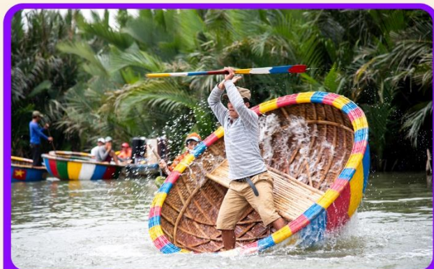
พิเศษ !!! นั่งเรือกระดัง UNSEEN เวียดนาม