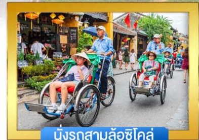
นั่งรถสามล้อซีโคล์