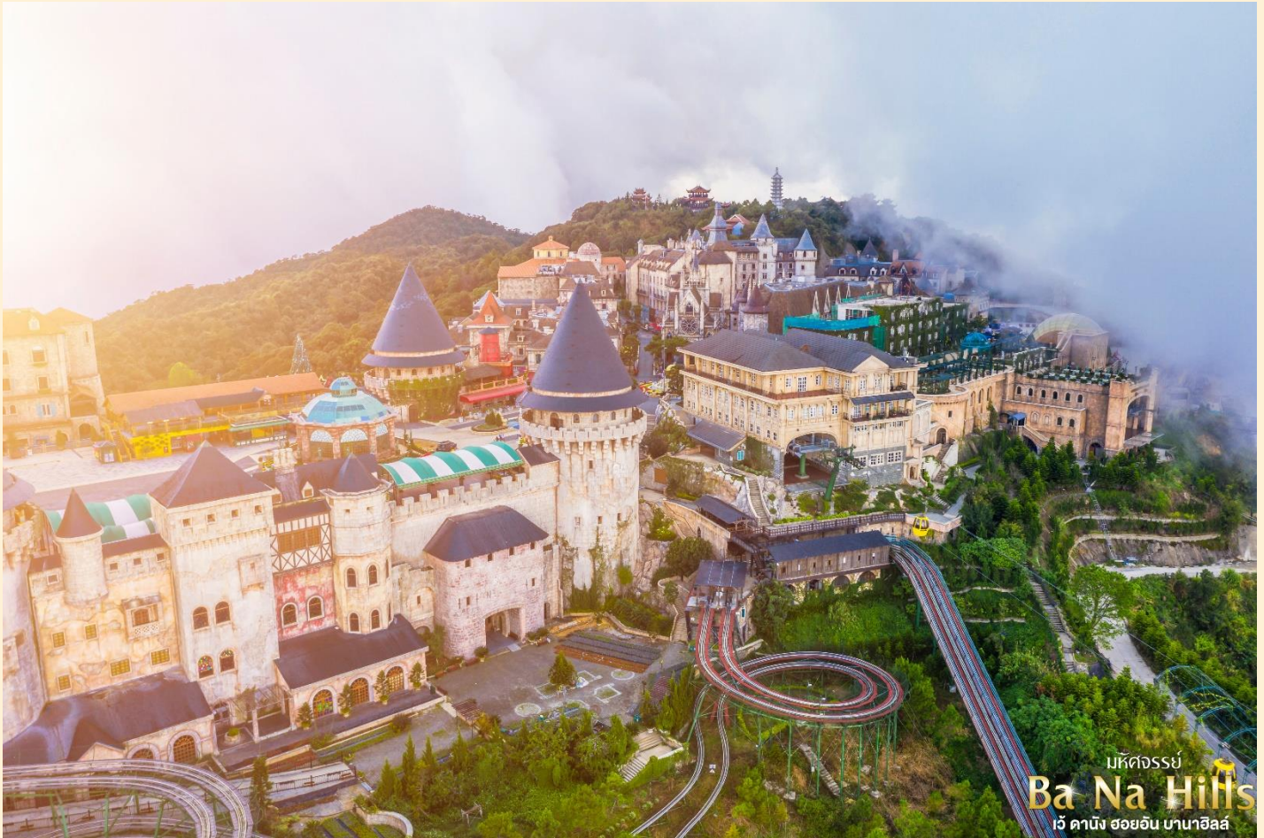
มหิดจรรย Ba Na Hills เว้ ดานัง ฮอยอัน บานาฮิลล์