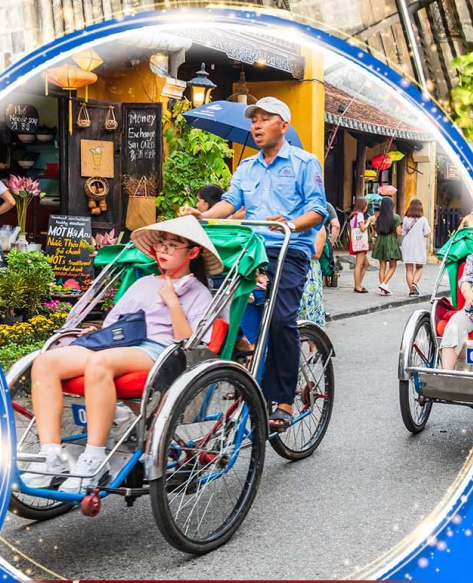
นั่งรถสามล้อช็อค

พักผ่อน บานาฮิลล์ 1 คืน นั่งกระเช้าที่ยาวที่สุดในโลก ขึ้นสู่บานาฮิลล์ ชมเมือง ฮอยอัน เมืองมรดกโลกที่สวยงามและเจียบสง พิเศษ!! บุฟเฟ่ต์นานาชาติ บานาฮิลล์