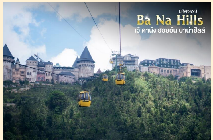
มหิดจรรย Ba Na Hills เว้ ดานัง ฮอยอัน บานาฮิลล์

กระเช้าแห่งบานาฮิลล์นี้ได้รับการบันทึกสถิติโลกโดย World Record ว่าเป็นกระเช้าไฟฟ้าที่ยาวที่สุดประเภท Non Stop โดยไม่หยุดแะมีความยาวทั้งสิ้น 5,042 เมตร และเป็นกระเช้าที่สูงที่สุดที่ 1,294 เมตรนักท่องเที่ยวจะได้สัมผัสสลุยเมฆหมอกและบางจุดมี