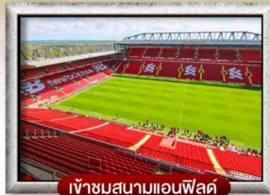
เข้าชมสนามแอนฟิลด์