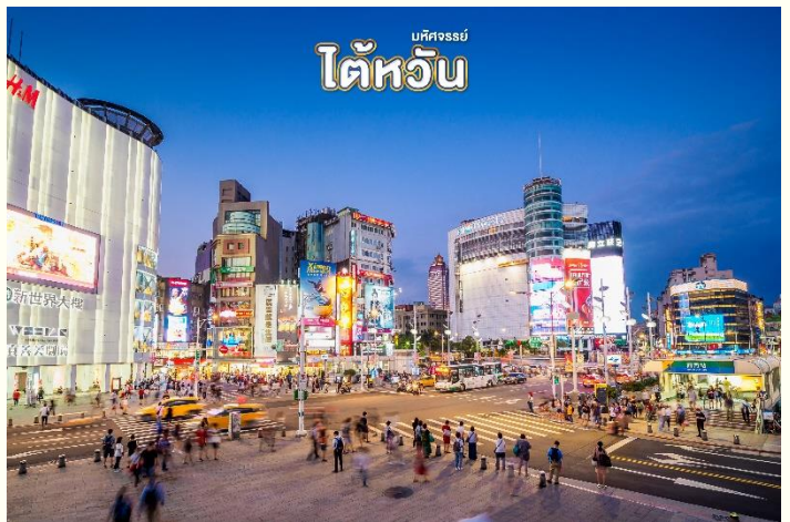
มัสยิด ไต้หวัน

หรือที่คนไทยรู้จักกันในนาม สยามสแควร์แห่งไทเปเป็นย่านช้อปปิ้งของวัยรุ่นและวัยทำงานของไต้หวัน ในย่านนี้เป็นถนนคนเดินโดยแบ่งโซนเป็นสีต่างๆ เช่น แดง เขียว น้ำเงิน โดยสังเกตจากเสาข้างทางจะมีการระบุหมายเลขและทำสีไว้อย่างเป็นระเบียบ ร้านค้า