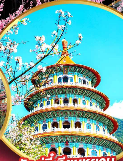
วัดอู๋จี้เทียนหยวน