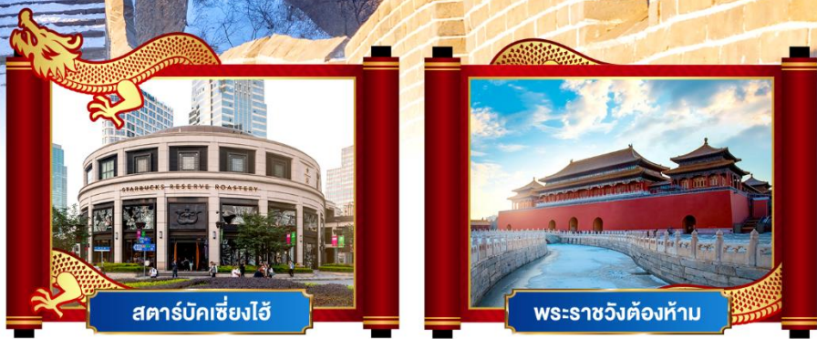
สตาร์บัคเซี่ยงไฮ้