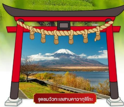
จุดชมวิวกะเลสาบคาวากุจิโกะ