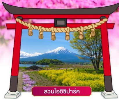
สวนโออิชิปาร์ค