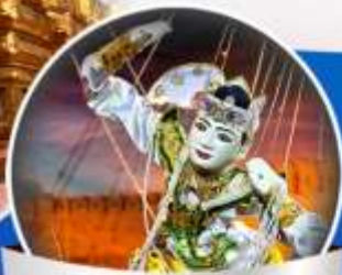
ชมโชว์หุ่นกระบอกเมืองพุกาม