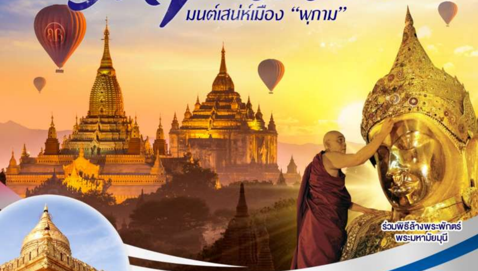
ร่วมพิธีล้างพระพักตร์ พระมหามัญมณี