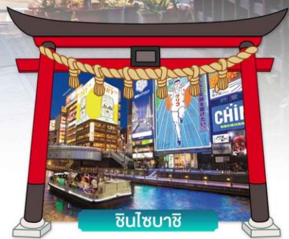
ชินโซนาชิ