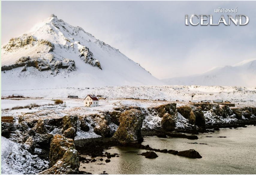
มหัศจรรย์ ICELAND

ผ่านชม คาบสมุทรสไนล์แฟลส์เนสส์ (Snæfellsnes peninsula) ทางฝั่งตะวันตกของเกาะ เต็มไปด้วยธรรมชาติที่ครบถ้วนทั้งน้ำตก ภูเขา ทะเล ที่มีลักษณะไม่เหมือนใครในโลก ตลอดทางท่านจะไม่สามารถหลับใหลได้อย่างแน่นอน