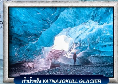
ถ้ำน้ำแข็ง VATNAJOKULL GLACIER

บินทรู สายการบิน Full Service | พิเศษ! ทานอาหารโดมกระจกิว 360 องศา