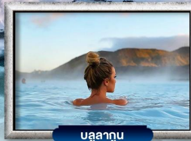
บลูลากูน