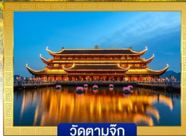
วัดตามจุก