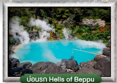
บ่อน้ำ Hells of Beppu