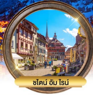
ชไตน์ อัม ไรน์