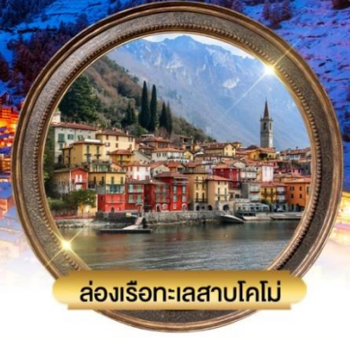
ล่องเรือทะเลสาบโคโม