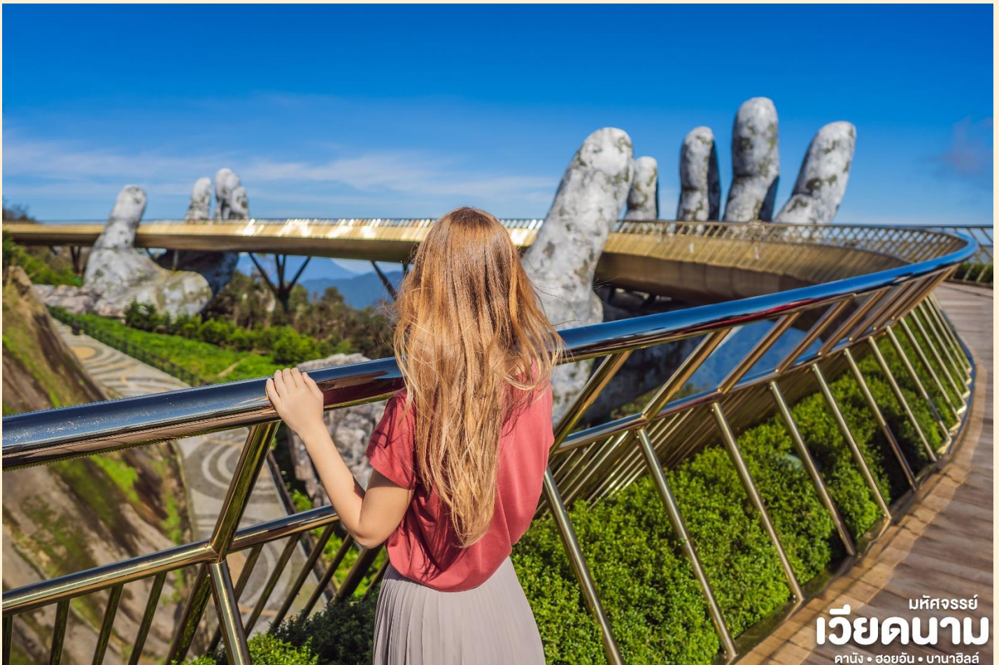
มหัศจรรย์ เวียงคานา คาบิง • ออยอิน • บานาฮิลล์

นำท่านชม สะพานสีทอง สถานที่ท่องเที่ยวใหม่ ล่าสุดตั้งโดดเด่นเป็นเอกลักษณ์อย่างสวยงาม บนเขาบานาฮิลล์ นำท่านสู่จุดที่สร้างความ ตื่นเต้นให้นักท่องเที่ยวมองดูอย่างอลังการที่ซึ่ง เต็มไปด้วยเสน่ห์แห่งตำนานและจินตนาการ ของการผจญภัยที่ สวนสนุก The Fantasy Park (รวมค่าเครื่องเล่นบนสวนสนุก ยกเว้น