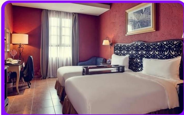
พักบนบานาฮิลล์ 1 คืน