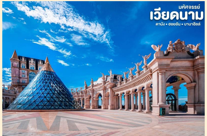
มหัศจรรย์ เวียดนาม ดานัง • ฮอยอัน • บานาฮิลล์

อิสระท่านชมเมืองฝรั่งเศส เป็นตึก ออกแบบมาได้บรรยากาศยุโรปแท้ๆแต่ มาเจอได้ใกล้ๆเพียงแค่เวียดนาม ลัด เลาะไปตามตรอกซอกซอย มีมุมถ่ายรูป เชคอินสวยๆหลายมุม Le Jardin d' Amour เป็นสวนสวยสไตล์ฝรั่งเศส ที่มี ทั้งดอกไม้ต้นไม้ มีมุมถ่ายรูปสวยๆ เต็ม ไปหมด รวมไปถึงมี โรงไวน์ Debay