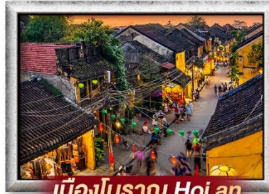
เมืองโบราณ Hoi an