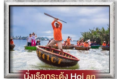
นั่งเรือกระดิง Hoi an