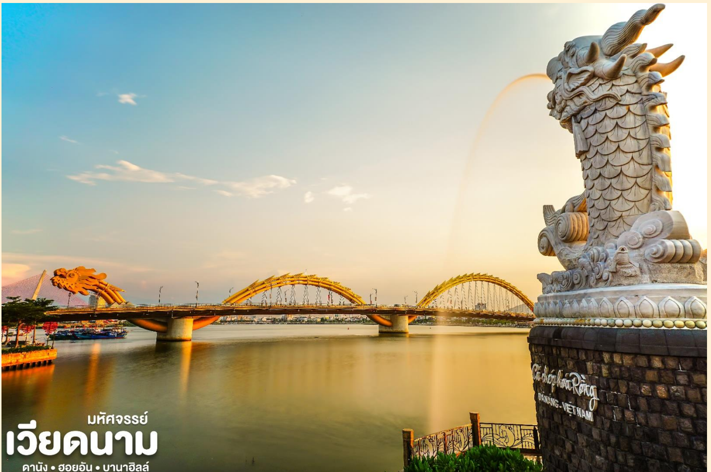
มหัศจรรย์ เวียดนาม ดานัง • ฮอยอัน • บานาฮิลล์

Wine Cellar อีกด้วยค่ะ เราเดินไปเที่ยวด้านในจะเป็นคล้ายๆ อุโมงค์ใต้ดินไวน์บ่มไวน์ เป็นทางยาว เดินทะลุชมไปเรื่อยๆ ก็จะออกมาที่สวน นอกจากนี้ เดินไปไม่กี่ไกลยังมีพระพุทธรูปองค์ใหญ่สีขาวสูง ถึง 27 เมตรอีกด้วย ให้ท่านเพลิดเพลินไปกับบานาฮิลล์ โซนใหม่ Eclipse Square ตามอัธยาศัย