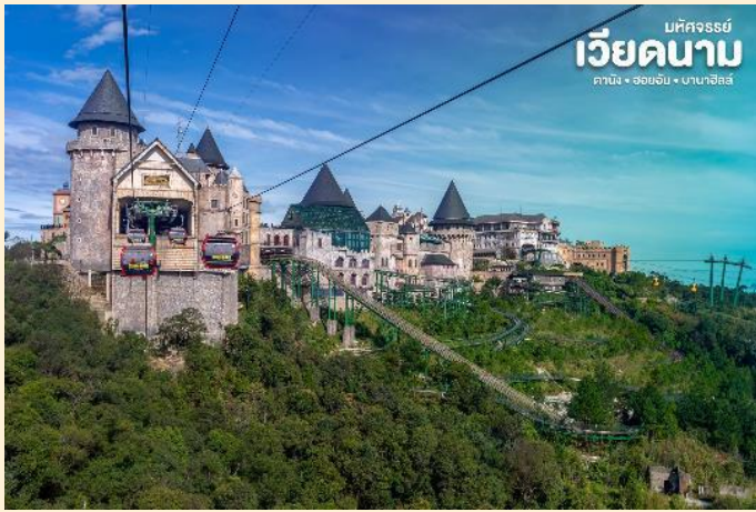
เบตจอร์จีย์ เวียดนาม คานิง - ออฮออัน - บานาฮิลล์