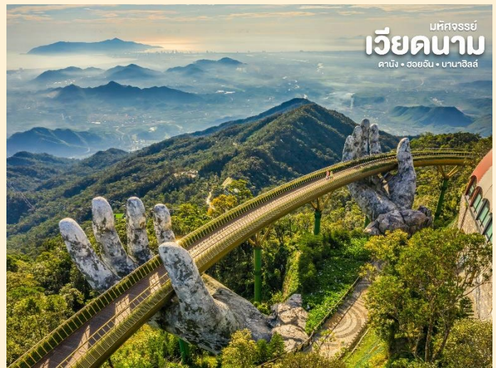
เบตจอร์จีย์ เวียดนาม คานิง - ออฮออัน - บานาฮิลล์

กระเช้าแห่งบานาฮิลล์นี้ได้รับการบันทึกสถิติโลกโดย World Record ว่าเป็นกระเช้าไฟฟ้าที่ยาวที่สุดประเภท Non Stop โดยไม่หยุดแวะมีความยาวทั้งสิ้น 5,042 เมตรและเป็นกระเช้าที่สูงที่สุดที่ 1,294 เมตรนักท่องเที่ยวจะได้สัมผัสบรรยากาศหมอกและบางจุดมีเมฆลอยต่ำกว่ากระเช้าพร้อมอากาศบริสุทธิ์อันสดชื่น