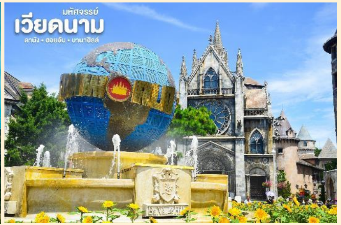
เบตจอร์จีย์ เวียดนาม คานิง - ออฮออัน - บานาฮิลล์