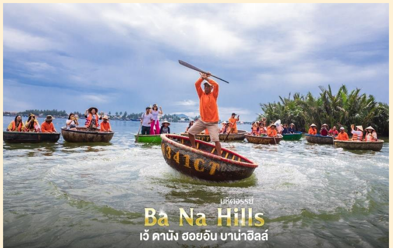
มรดกจรรยา Ba Na Hills เว้ ดานัง ฮอยอัน บาน่าฮิลล์

นำท่านชม ร้านหินอ่อน ให้ท่านเลือกชมและซื้อของฝากเป็นที่ระลึก นำท่านเดินทางสู่ หมู่บ้านกัมทาน สนุกสนานไปกับกิจกรรม!! นั่งเรือกระดัง Cam Thanh Water Coconut Village หมู่บ้านเล็กๆในเมืองฮอยอันตั้งอยู่ในสวนมะพร้าวริมแม่น้ำ ในอดีตช่วงสงครามที่นี่เป็นที่พักอาศัยของเหล่าทหาร อาชีพหลักของคนที่นี่คืออาชีพประมง ระหว่างการล่องเรือท่านจะได้ชมวัฒนธรรมอันสวยงาม ชาวบ้านจะขับร้องเพลงพื้นเมือง ผู้ชายกับผู้หญิงจะหยอกล้อกันไปมา นำที่พายเรือมาเคาะกันเป็นจังหวะดนตรีสุดสนุกสนาน (ไม่รวมค่าทิปคนพายเรือ ท่านละ 40 บาท/ต่อท่าน/ต่อทริป)