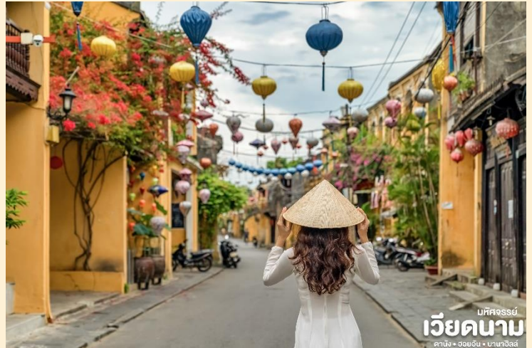
บพีศจรรย์ เวียดนาม ดานัง • ฮอยอัน • บานาฮิลล์

เมืองฮอยอันนั้นอดีตเคยเป็นเมืองท่า การค้าที่สำคัญแห่งหนึ่งในเอเชียตะวันออกเฉียงใต้และเป็นศูนย์กลางของการ แลกเปลี่ยนวัฒนธรรมระหว่างตะวันตกกับตะวันออกองค์การยูเนสโกได้ประกาศให้ฮอยอันเป็นเมืองมรดกโลกทางวัฒนธรรมเนื่องจากเป็นสถานที่สำคัญทางประวัติศาสตร์ แม้ว่าจะผ่านการบูรณะขึ้นเรื่อยๆ แต่ก็ยังคงรูปแบบของเมืองฮอยอันไว้ได้