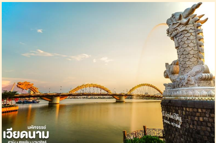
มหิตจรรย เวียดนาม ดานัง • ฮอยอัน • บาน่าฮิลล์

คุ้มครองชาวประมงที่ออกไปหาปลา นอกชายฝั่งวัดแห่งนี้นอกจากเป็นสถานที่ศักดิ์สิทธิ์ที่ชาวบ้าน