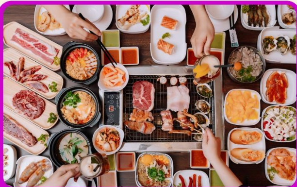
พิเศษ!! เมนูซาซิมิ+บุฟเฟ่ต์ปิ้งย่าง