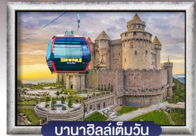
บาน่าฮิลล์เต็มวัน