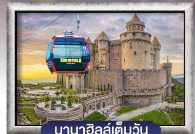
บาน่าฮิลล์เต็มวัน