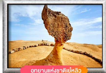
อุทยานแห่งชาติหลิว

เมนู สุดพิเศษ !! เสี่ยวหลงเปา, ปลาประธนาธิบติ, ซาบูบุฟเฟ่ต์สไตล์ไต้หวัน