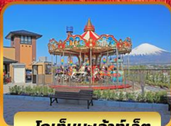
โกเกมบะเจ้าท์เล็ด