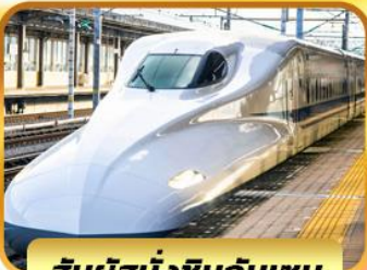
สัมผัสนั่งชินกันเซน