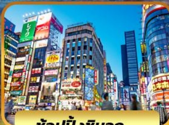
ช้อปปิ้งชินจูกุ