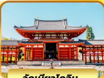
วัดเบียวโดอิน